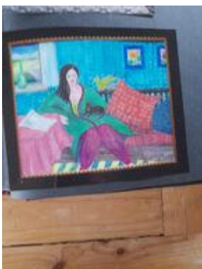
Bild handgemalt Bei Interesse: 160 OND, TEL. 0175 9672136